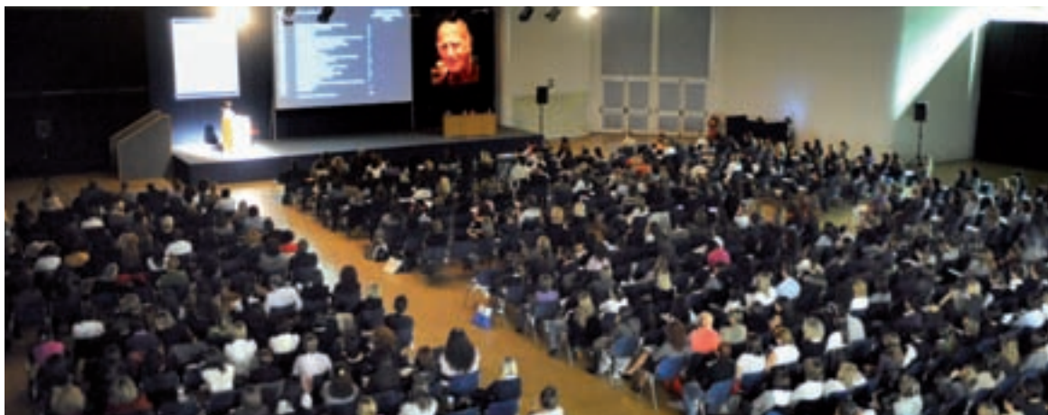
La grande affluenza al Memorial, testimoniata da questa immagine