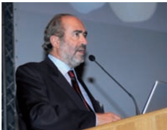
Prof. Massimo de Sanctis

matiche sia un trattamento interdisciplinare, condotto da un team di specialisti. Possibilità e limiti di intervento di ciascun componente del team devono essere definiti chiaramente quando siano presenti aspetti di parodontologia, implantologia, ortodonzia e chirurgia maxillo-facciale. La complessità e variabilità delle situazioni che si presentano sono state evidenziate attraverso l'esposizione di numerosi casi clinici che mostrano le ampie potenzialità di intervento. Permangono, nell'ortodonzia su pazienti adulti, due limiti fondamentali: l'impossibilità di sfruttare i fenomeni legati alla crescita e la necessità di una grande collaborazione da parte del paziente.