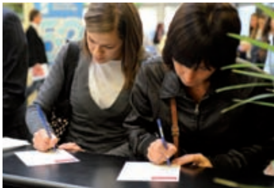
Accettazione iscrizioni presso la segreteria corsi

Tutte queste operazioni sono riservate e completamente gratuite per chi si iscrive on line